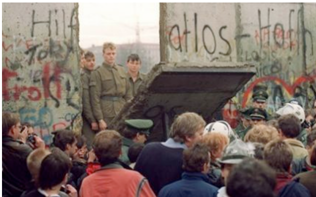
Chute du mur - Novembre 1989

La chute du mur de Berlin, il y a vingt cinq ans, mettait fin à la privation de liberté des peuples à l'Est du continent.