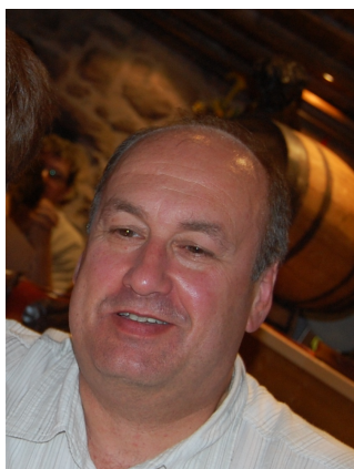
Requiescat in pace

La commune lui doit beaucoup, et son départ bien trop prématuré, est venu endeuiller la fin de ce mandat.